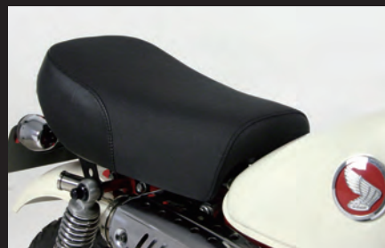
モンキー(キャブレター車)装着写真