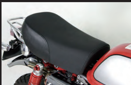
モンキー(FI)装着写真