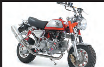
モンキー(FI)装着写真