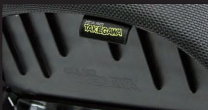
弊社ロゴ/タグ付き