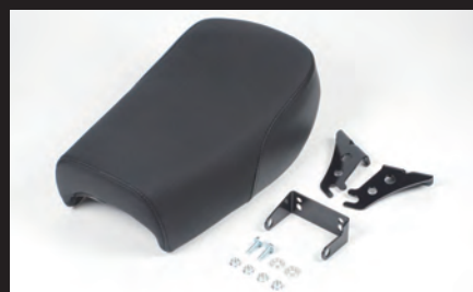
ストリートミニ ロータイプシート

■モンキー(FI)にストリートミニシートを装着するには、バッテリーの移設が必要な為、弊社製バッテリーケースキット 05-06-0007 ¥10,500(税抜)の別途購入が必要になります。他にバッテリーケースキットにはABS製サイドカバー付きセットがあります。詳しくはWEB SITEをご覧ください。