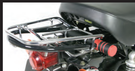
純正キャリア対応