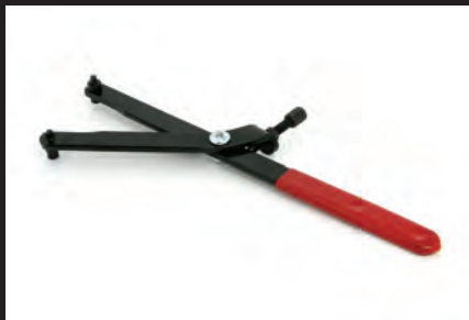
ユニバーサルホルダー