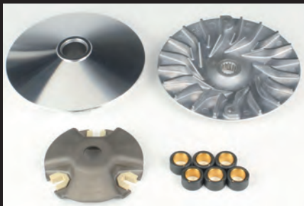
ハイスピードプリーキット

※付属のウエイトローラーはすべての状況において最適なセッティングとなるものではありません。車両の仕様(弊社製以外のマフラーなど)や走行する状況等により、セッティングが異なる場合があります。