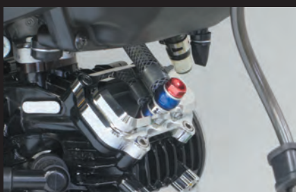
弊社製スーパーヘッド4V+Rシリンダーヘッドのインスペクションブリーザーカバーに接続可能