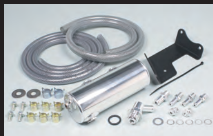
オイルキャッチタンクキット

※ブリーザーキャップにはオイルレベルゲージが付いていない為、オイル量を点検する際はノーマルオイルレベルゲージをご使用下さい。