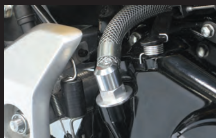
ブリーザーキャップ(スイベルタイプ)付属