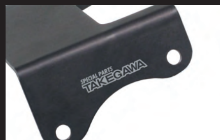
ステーには弊社ロゴのпат印刷入り