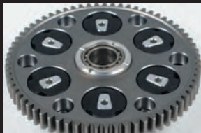
プライマリードライブギア (ダンパー内蔵)