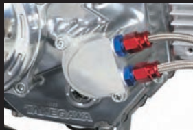
オイルクーラーユニット装着