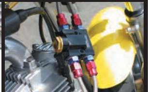
インラインサーモユニット装着