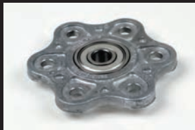
アルミダイカスト製リフタープレート