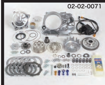
クラッチリリース時