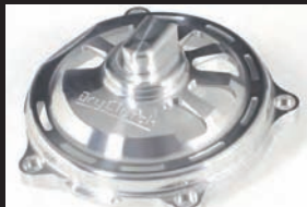
NEW クラッチカバー (油圧式用)