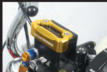
装着イメージ(ゴールド)