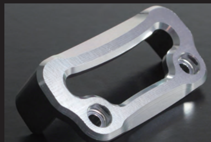
マシニング加工により素材を美しくカット