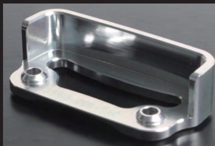
マスターシリンダーガード裏側