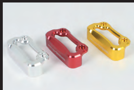
カラーラインナップ

ホンダ : Ape50/100 Type-D(ディスクブレーキ車)・XR50/100Motard・GROM/MSX125 カワサキ: Z125PRO・KSR110・KSR PRO・Dトラッカー125・Ninja250R