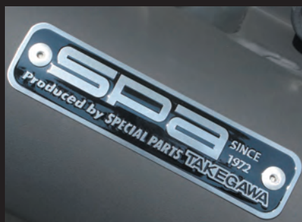
SPA マフラープレート