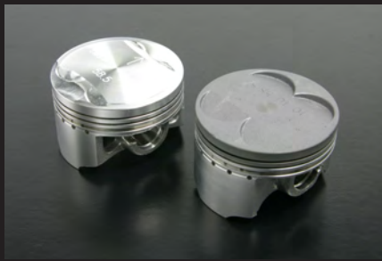
左:ハイコンプピストン/右:スタンダードピストン