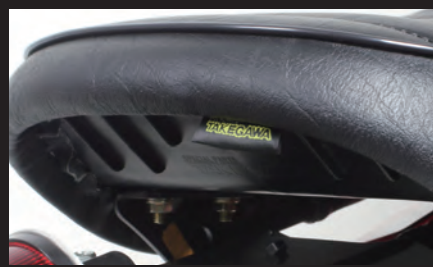
弊社ロゴ入りのタグ付き