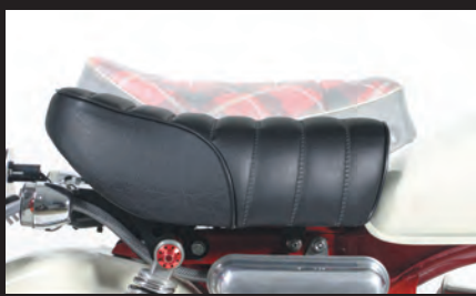
ノーマルとの比較