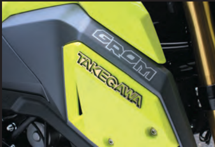
大サイズ装着写真(ゴールド/GROM)