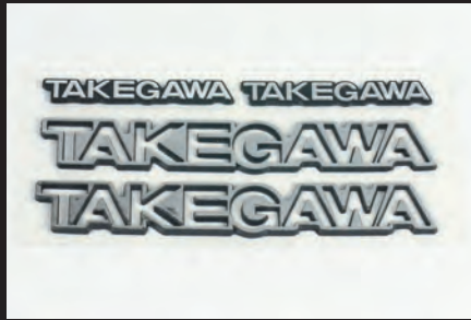
コンベックスエンブレム(シルバー)

貼り付け後、接着力を強くする為に上から良く押し付けて下さい。貼り付け後1、2日間は洗車や雨中走行を行わないで下さい。