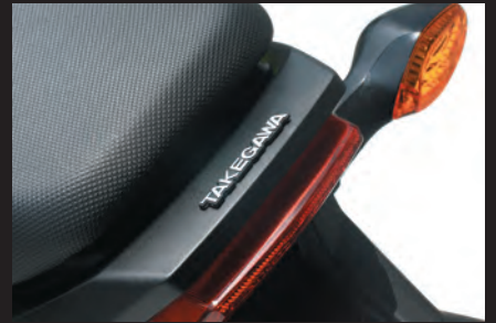
小サイズ装着写真(シルバー/GROM)