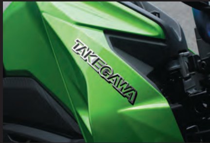
大サイズ装着写真(シルバー/Z125 PRO)