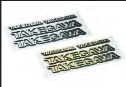
シルバーとゴールドの2種類