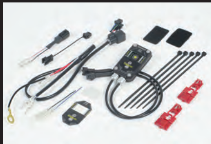
FIコン2(インジェクションコントローラー)

※この大容量フューエルインジェクタは指定外のエンジン仕様車両に装着しても不調となるだけで、セッティングは出せません。