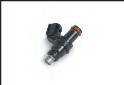
大容量フューエルインジェクタ