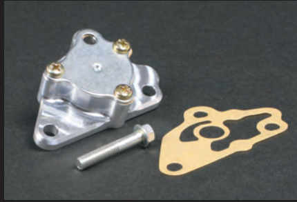
ビレットスーパーオイルポンプ