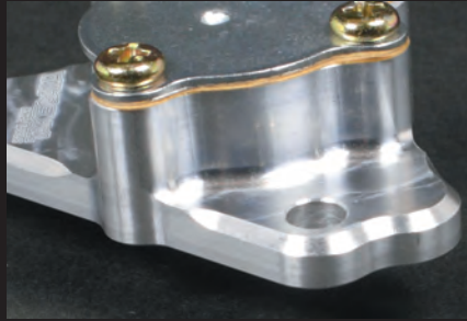
アルミ削り出しオイルポンプボディ