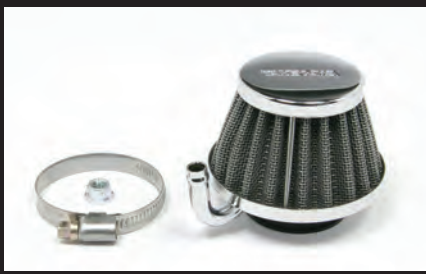
エアフィルター(ノーマルスロットルボディ用)