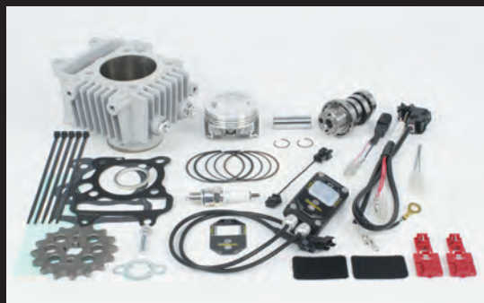
ハイパーSステージボアアップキット88cc

このフィルターはノーマルエアクリーナーボックスを外し取付けるだけで吸入効率が大幅に向上し、高回転域での出力アップが可能になります。又、弊社製マフラーと同時装着する事で更に出力アップが可能になります。