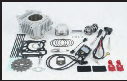
ハイパーSステージボアアップキット88cc

このフィルターはノーマルエアクリーナーボックスを外し取付けるだけで吸入効率が大幅に向上し、高回転域での出力アップが可能になります。又、弊社製マフラーと同時装着する事で更に出力アップが可能になります。