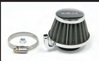
エアフィルター(ノーマルスロットルボディ用)