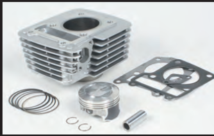
Sステージボアアップキット138cc(カムシャフト無し)