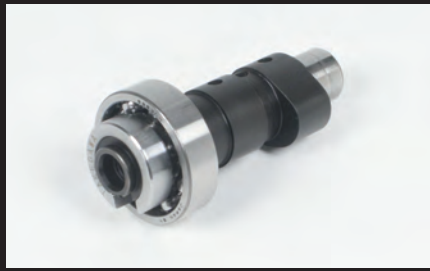
スポーツカムシャフト

コーンオーバーバルマフラー(スリップオン) 品番04-02-0241 ¥41,000(税抜) パワーサイレントオーバーバルマフラー(スリップオン) 品番04-02-0242 ¥38,800(税抜)