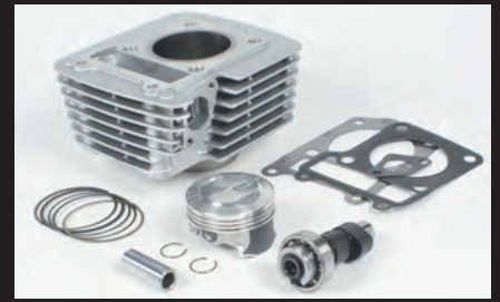
Sステージボアアップキット138cc(カムシャフト付属)