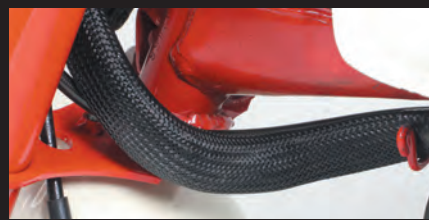
ハーネスネック部分にメッシュチューブを採用