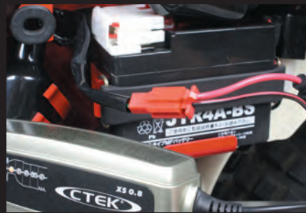
バッテリーを外さなくても充電可能