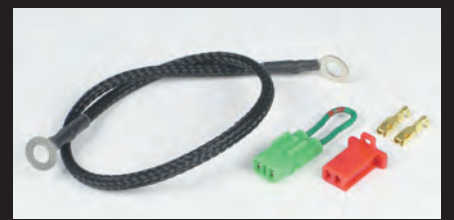
追加アース線/コネクター/端子付属