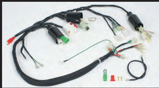
スーパーメインハーネスキット

※ゴリラにご使用の場合は別途ウインカーボディーアース線の追加とウインカーリレー部の配線の延長等の加工が必要になります。 ※サイドスタンドスイッチ付きの車両で純正サイドスタンドを使用される場合、2極の場合は接続出来ますが、3極の場合は接続出来ない為、付属のサイドスタンドスイッチコネクターを使用して下さい。この場合、サイドスタンドインジケーターランプは使用出来ません。 ※モンキーBAJA、モンキーRには使用出来ません。