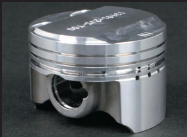
高剛性アルミ鍛造ピストン