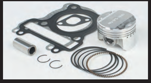
ハイコンピストンキット