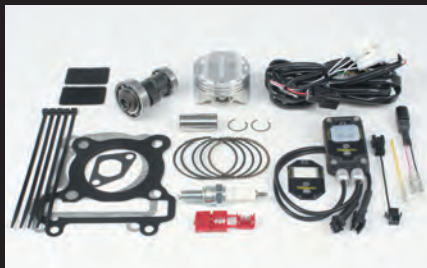
ハイパーチューニングセット (01-02-0012) シグナスX/SR(SEA5J)BF91用