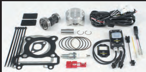
ハイパーチューニングセット (01-02-0012) シグナスX/SR(SEA5J)BF91用