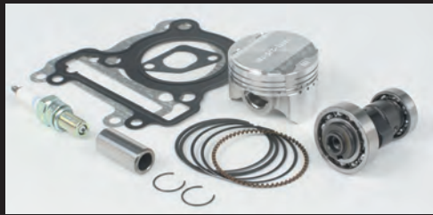
ハイパーチューニングセット (01-02-0009) シグナスX/SR(SE12J)5UA用

弊社製各種マフラー(サイレントスポーツマフラー/サイレントオーバルマフラー/コーンオーバルマフラー) 弊社WEB SITE、又はWEBカタログをご覧ください。