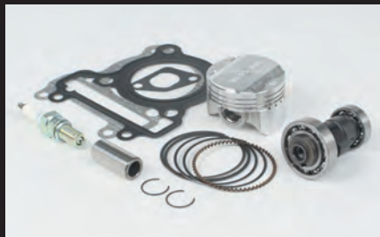
ハイパーチューニングセット (01-02-0009) シグナスX/SR(SE12J)5UA用

※純正ECUのレプリミット回転数を越えることが出来ますが、メーカー純正のレプリミットを超える使用方法になる為、自己責任でご使用下さい。