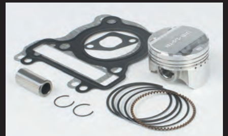
ハイコンピストンキット