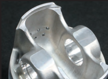
高剛性アルミ鍛造ピストン