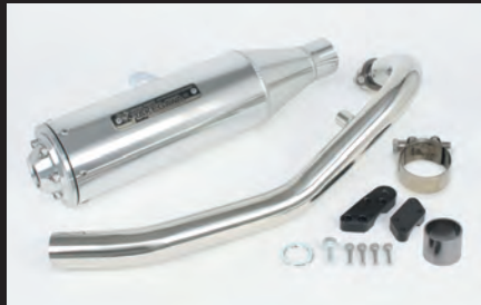
トラックーマフラー(シルバー)