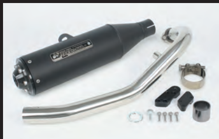
トラックーマフラー(ブラック)