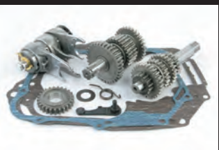
TAF5速クロスミッションキット