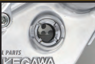
オイルレベル確認窓