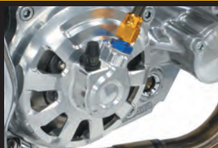
新形状 クラッチカバー(油圧式)

※弊社製乾式クラッチ用5・6速クロスミッションの同時装着が必要になります。WEBカタログ参照 又、モンキー キャブレター車とインジェクション車ではクロスミッションキットの品番が異なります。 ※スリッパークラッチは構造上、エンジン始動時、クラッチに滑りが発生しますので、必ずオートデコンプレッション機能付きカムシャフトをご使用下さい。 デスモドミックツインカム4Vボアアップキット、モンキー(FI)用エンジンパーツにはオートデコンプレッション機能付きカムシャフトの設定はありませんが、スリッパークラッチをご使用頂けます。 ※ノーマルマフラー、アップタイプマフラーの同時装着は出来ません。