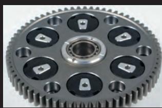
プライマリードリブギア(ダンパー内蔵)