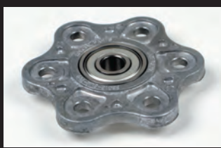
アルミダイカスト製リフタープレート