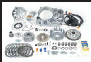
17乾式クラッチキット TYPE-R(油圧式)

17乾式クラッチキット TYPE-R (油圧式)とTAF5速クロスミッションキットがセット価格で 新登場!!