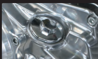
大型オイルフィルターキャップ