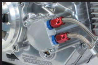
オイルクーラーユニット