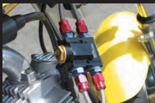
インラインサーモユニット