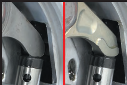
プッシュロッド接地面の比較 左:ノーマル 右:弊社製