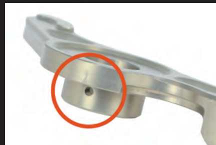
アーム可動部にオイル穴を採用