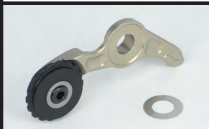
スーパーカムチェーンテンショナー