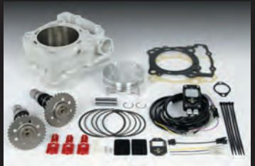
ハイパーボアアップキット305cc