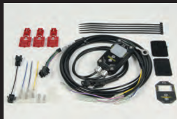
FIコン2(インジェクションコントローラー)