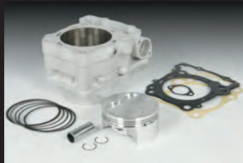
ボアアップキット305cc

■弊社製ボアアップキット305ccを取付けする際、弊社製クラッチスプリング27kセット 02-01-0143 の同時装着をお薦めします。