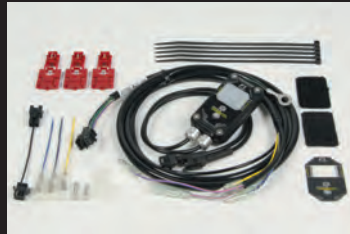
FIコン2(インジェクションコントローラー)