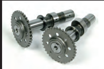
スポーツカムシャフト