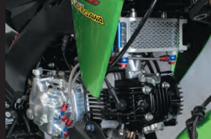
シュラウドステーに弊社製オイルクーラー装着可能