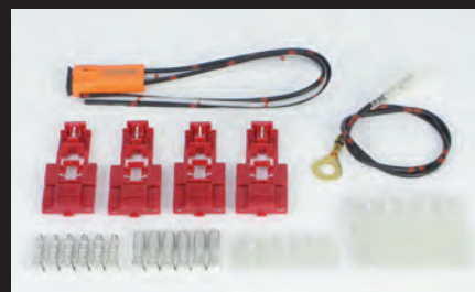
ダイオードハーネスキット