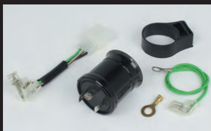
ワイドレンジフラッシャーリレー(3極・作動音有タイプ)