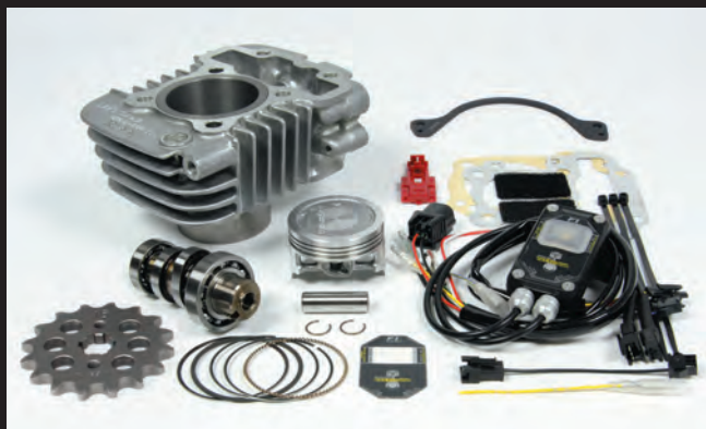
Hyper S-Stageボアアップキット81cc

ハイパーSステージ81ccキットに付属の16Tドライブスプロケットを装着する場合、純正ガードプレートに干渉し取付け出来ない為、本製品が必要になります。