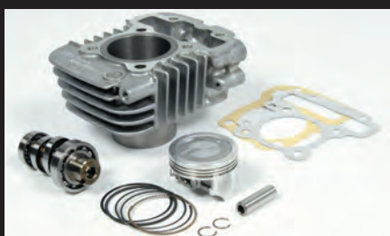
S-Stageボアアップキット81cc