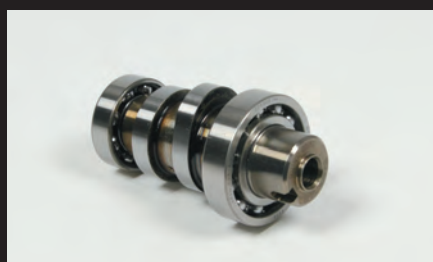
スポーツカムシャフト

■スチール製ドライブスプロケット:弊社製ドライブスプロケットは下記12T、13T、14T、15T、16Tの5種類からお選び頂けます。※17Tに関してはガードが干渉し、取付け出来ません。