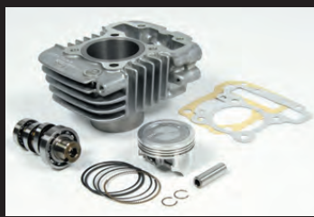
S-Stageボアアップキット81cc