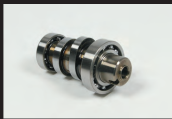
スポーツカムシャフト

ハイパーSステージボアアップキットはSステージボアアップキットにFIコン2(インジェクションコントローラー)、ドライブスプロケット16T、スプロケットガードプレートが付属しています。