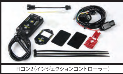
Fコン2(インジェクションコントローラー)