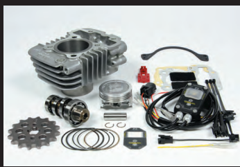
Hyper S-Stageボアアップキット81cc