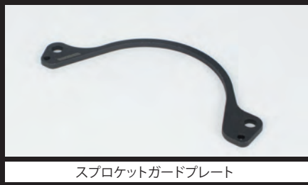
スプロケットガードプレート