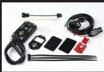
FIコン2(インジェクションコントローラー)