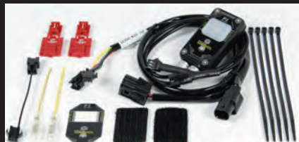
FIコン2(インジェクションコントローラー)