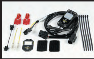
Fコン2(インジェクションコントローラー)