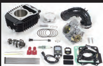
Hyper S-Stage N15 ポアアップキット181cc (ビッグスロットルボディー仕様)