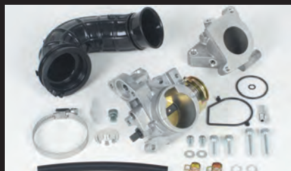
ビッグスロットルボディーキット(ノーマルヘッド用)