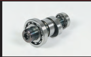
スポーツカムシャフト(N-15)

※ビッグスロットルボディークिटに対応する為、エアクリナーボックスの穴径を広げる加工が必要です。