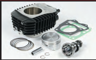
S-Stage N15 ボアアップキット181cc (スポーツカムシャフト付属)