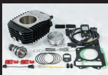
Hyper S-Stage N15 ボアアップキット181cc (ノーマルスロットルボディー仕様)

ノーマルシリンダーヘッドの性能を最大限に引出し、高出力化を実現します。高回転域までストレス無く回るエンジン特性をお楽しみ頂けます。ビッグスロットルボディー ボア径:φ34 ノーマルエアクリーナーボックスに接続出来るコネクティングチューブ付属。