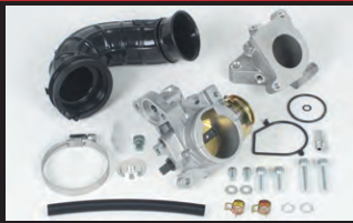
ビッグスロットルボディークिट (ノーマルヘッド用)