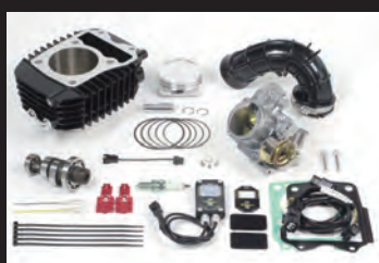
Hyper S-Stage N15 ボアアップキット181cc (ビッグスロットルボディー仕様)