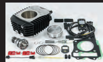
Hyper S-Stage N15 ポアアップキット181cc (ノーマルスロットルボディー仕様)

※弊社製エンジンパーツ装着車用です。他社製エンジンパーツとの併用は行わないで下さい。エンジン不調や故障の原因となる恐れがあります。 ※社外品のH.I.D キットや他社製LEDヘッドライトやフォグランプ類は、絶対に同時装着しないで下さい。バラスト/インバーター(電圧変換装置)からデジタル回路に悪影響を与える高電圧ノイズが出る物が有り、製品故障や動作不良の原因となります。 ※ヘッドライトON/OFFスイッチ、社外品点火装置の同時装着は行わないで下さい。