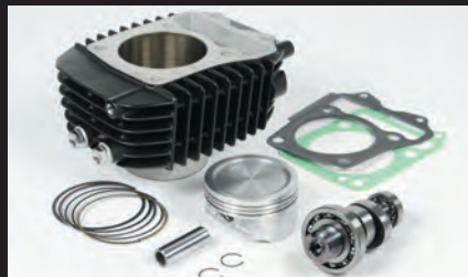
S-Stage N15 ボアアップキット181cc