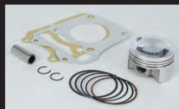
ハイコンピピストンキット