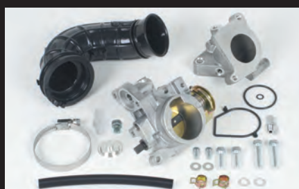
ビッグスロットルボディーキット(ノーマルヘッド用)