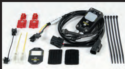
FIコン2(インジェクションコントローラー)