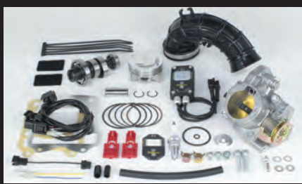
ハイパーチューニングセット (ビッグスロットルボディ付属)