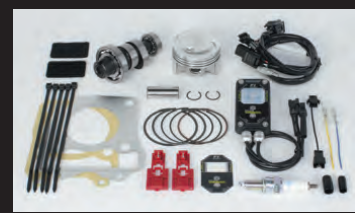
ハイパーチューニングセット (ビッグスロットルボディー無し)

ハイパーチューニングセットには、ハイコンピピストンキットにスポーツカムシャフト、Fロン2(インジェクションコントローラー)、スパークプラグが付属しています。更にビッグスロットルボディー無し(ノーマルスロットルボディー仕様)とビッグスロットルボディーキット付属の2種類からお選び頂けます。