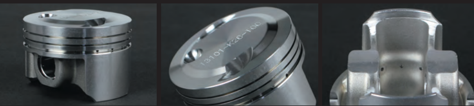
高圧縮比化に耐えるように高剛性アルミ鍛造材を採用。