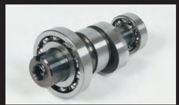
スポーツカムシャフト(N-15)