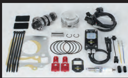
ハイパーチューニングセット (ビッグスロットルボディ無し)

ノーマルシリンダーヘッドの性能を最大限に引出し、高出力化を実現します。高回転域までストレス無く回るエンジン特性をお楽しみ頂けます。ビッグスロットルボディ ボア径:φ34 ノーマルエアクリナーボックスに接続出来るコネクティングチューブ付属。