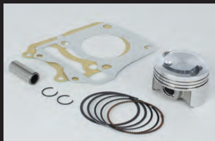
ハイコンピストンキット

ノーマルシリンダーヘッドの性能を最大限に引出し、高出力化を実現します。高回転域までストレス無く回るエンジン特性をお楽しみ頂けます。ビッグスロットルボディー ボア径:34mm ノーマルエアクリナーボックスに接続出来るコネクティングチューブ付属。