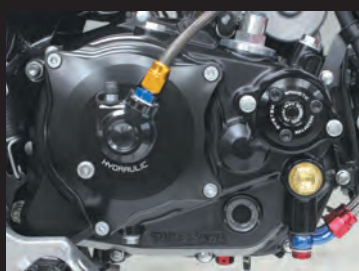
GROM スペシャルクラッチカバー (WET/油圧式) 装着