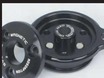
オイルフィルターカバー内にマグネットを内蔵