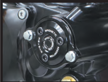
レーザーマーキングロゴ入り