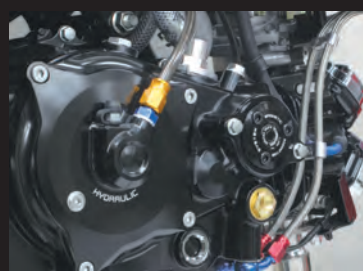
GROM スペシャルクラッチカバー (WET/油圧式) 装着