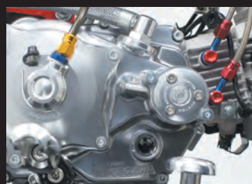
モンキー スペシャルクラッチカバー TYPE-R(WET/油圧式)装着