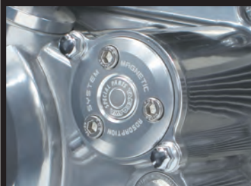
レーザーマーキングロゴ入り