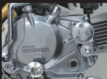
モンキー スペシャルクラッチカバー(ダイカスト製)装着