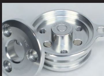
オイルフィルターカバー内にマグネットを内蔵