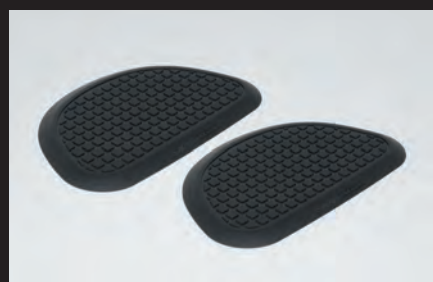
ニーグリップパッド(2個セット)