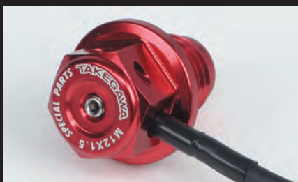
スティック温度センサー差込穴/ワイヤーロック穴