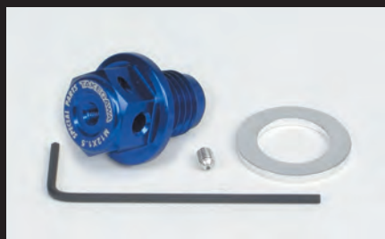
マグネット付きドレンボルト(M12×P1.5)(ブルー)

エンジンオイルに混ざった鉄粉をドレンボルトに設けたマグネットが強力な磁力で吸着します。これにより、オイル内にある鉄粉が減少し、エンジンオイル本来の安定した潤滑性能を発揮することが可能となります。更に弊社製アルミドレンボルトには、脱落防止としてワイヤーロックが行えるワイヤーロック穴と弊社製スティック温度センサー差込穴を備えております。スティック温度センサーの取付けが可能なことで、弊社製コンパクトLEDサーモメーター(スティック温度センサー付き)、又はサーモメーター付き各種メーターを別途ご購入頂くことでドレンボルト部での温度を計測することが出来ます。ドレンボルト本体はアルミ材を精巧に削り出し、表面にカラーアルマイトを施しています。カラーはシルバーブラック、ブルー、レッドの4種類。ノーマルドレンボルトから美しく仕上げられた弊社製アルミドレンボルトへ変更することで、エンジン周りにワンポイントとしてドレスアップすることが出来ます。弊社ロゴレーザーマーキング入り マグネットには磁力が強力なネオジムマグネットを採用。 ■M12×P1.5の純正ドレンボルトと交換してご使用頂けます。参考装着可能車両は下記をご覧ください。