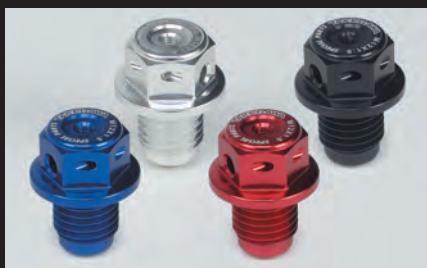
カラーラインナップ