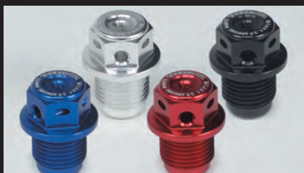
カラーラインナップ