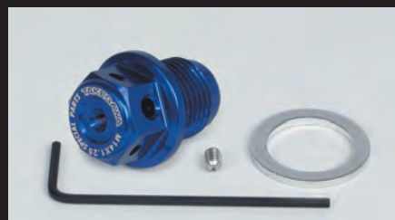
マグネット付きドレンボルト(M14×P1.25) (ブルー)

エンジンオイルに混ざった鉄粉をドレンボルトに設けたマグネットが強力な磁力で吸着します。これにより、オイル内にある鉄粉が減少し、エンジンオイル本来の安定した潤滑性能を発揮することが可能となります。更に弊社製アルミドレンボルトには、脱落防止としてワイヤーロックが行えるワイヤーロック穴と弊社製スティック温度センサー差込穴を備えております。スティック温度センサーの取付けが可能なので、弊社製コンパクトLEDサーモメーター(スティック温度センサー付き)、又はサーモメーター付き各種メーターを別途ご購入頂くことでドレンボルト部での温度を計測することが出来ます。ドレンボルト本体はアルミ材を精巧に削り出し、表面にカラーアルマイトを施しています。カラーはシルバーブラック、ブルー、レッドの4種類。ノーマルドレンボルトから美しく仕上げられた弊社製アルミドレンボルトへ変更することで、エンジン周りにワンポイントとしてドレスアップすることが出来ます。弊社ロゴレーザーマーキング入り マグネットには磁力が強力なネオジムマグネットを採用。 ■M14×P1.25の純正ドレンボルトと交換してご使用頂けます。 ※下記参考車両はネジサイズの合う車両を一部抜粋しております。実際の取り付けに関しましては未確認(温度センサー取付部のクリアランス等)の為、詳細図での寸法確認や現車による確認作業が必要になります。又、車両名が同じであっても、年式によりネジサイズが異なる場合がありますので、現車確認が必要です。