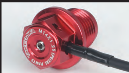
スティック温度センサー差込穴/ワイヤーロック穴