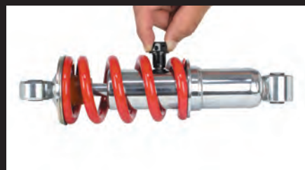
約1.6kgのリアショックも持ち上げる強力な磁力