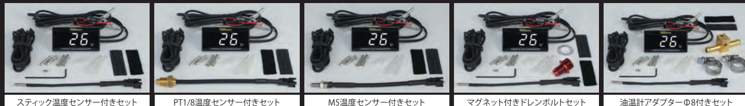
スティック温度センサー付きセット

※ヘッドライトON/OFFスイッチ、社外品点火装置の同時装着は行わないで下さい。