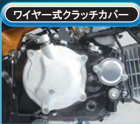
ワイヤー式クラッチカバー