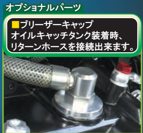
オプションパーツ