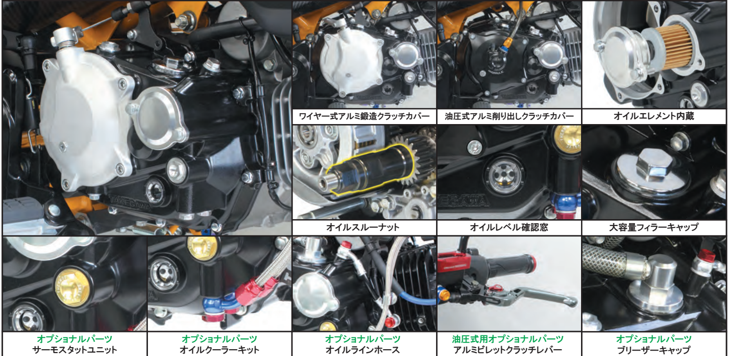
ワイヤー式アルミ鍛造クラッチカバー

ノーマルクラッチのまま装着出来るスペシャルクラッチカバーキットに“モンキー125(JB02)用”が 新登場!! 機能性と発展性に優れたスペシャルクラッチカバーはノーマルクラッチからスペシャルクラッチへのバージョンアップが可能です。