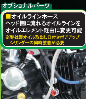
オプションパーツ

■オイルクーラーキット オイルクーラーへのオイル取出し が可能。※専用オイルクーラーキット有