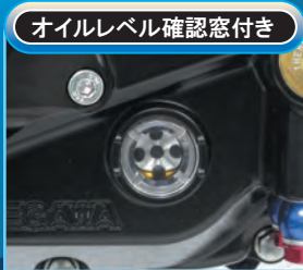
オイルレベル確認窓付き