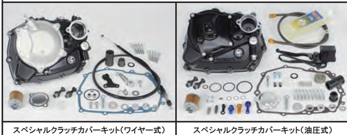
スペシャルクラッチカバーキット(ワイヤー式)