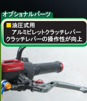
オプションパーツ

■オイルラインホース ヘッド側に流れるオイルラインを オイルエレメント経由に変更可能 ※弊社製オイル取出し口付きボアアップ シリンダーの同時装着が必要