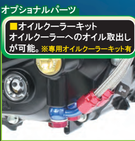
オプションパーツ

■サーモスタットユニット オーバーヒートを防止します。 ※オイルクーラーキットの同時装着が必要