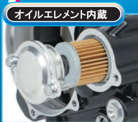
オイルエレメント内蔵