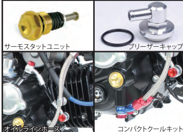
サーモスタットユニット