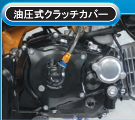
油圧式クラッチカバー