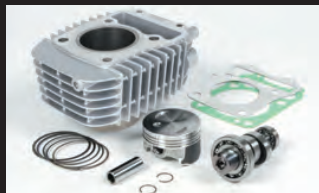
e-Stageボアアップキット143cc