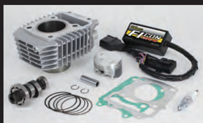
Hyper e-Stageボアアップキット143cc (ノーマルスロットルボディ仕様)

キット構成は、ノーマルシリンダーヘッド用ビッグスロットルボディキットにビッグスロットルボディ用エアフィルターキット、センサーステーキットが付属しています。ノーマルシリンダーヘッドの性能を最大限に引出し、高出力化を実現します。高回転域までストレス無く回るエンジン特性をお楽しみ頂けます。ビッグスロットルボディ ボア径:Φ34 エアフィルターキット(ビッグスロットルボディ用):表面積の増大により、高い吸入効率を得ることが出来ます。ブローバイユニオン付き ■ビッグスロットルボディキットには、フューエルインジェクターASSY.(00-00-0487)が付属しています。