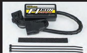
FICON TYPE-e(インジェクションコントローラー)