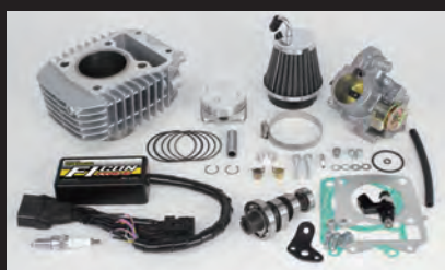
Hyper e-Stageボアアップキット143cc (ビッグスロットルボディ仕様)