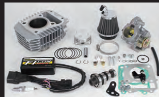
Hyper e-Stageボアアップキット143cc