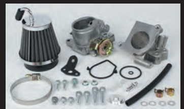
ビッグスロットルボディーキット