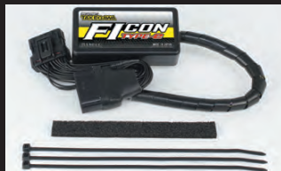
FIコンTYPE-e(インジェクションコントローラー)