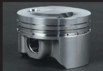
高圧縮比化に耐えるように高剛性アルミ鍛造材を採用。