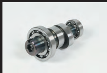
スポーツカムシャフト(N-15カム)