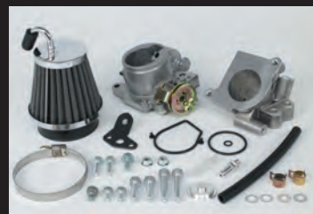
ビッグスロットルボディークット