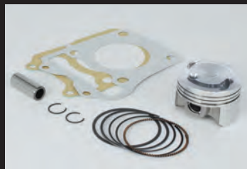
ハイコンプピストンキット

■ハイパーチューニングセットは、ハイコンプピストンキットにスポーツカムシャフト(N-15)、FICON2(インジェクションコントローラー)、スパークプラグが付属。更にビッグスロットルボディー無し(ノーマルスロットルボディー仕様)とビッグスロットルボディーキット付属の2種類からお選び頂けます。