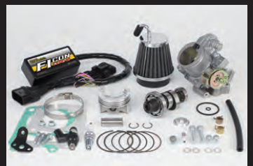
ハイパーチューニングキット (ビッグスロットルボディー付属)