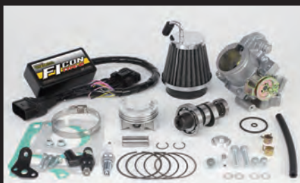
ハイパーチューニングセット (ビッグスロットルボディ付属)