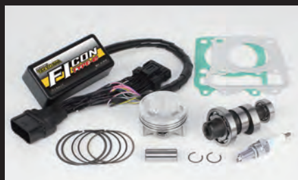
ハイパーチューニングセット (ビッグスロットルボディ無し)

■ビッグスロットルボディキットには、フューエルインジェクターASSY.(00-00-0487)が付属しています。