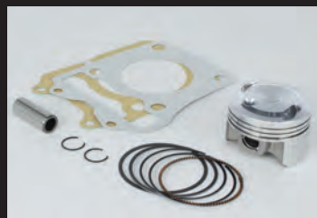
ハイコンピピストンキット