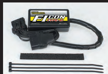
FIコンTYPE-e(インジェクションコントローラー)