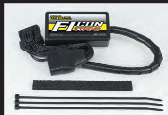
FICON TYPE-e(インジェクションコントローラー)