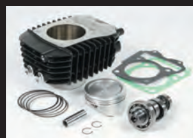
S-Stageボアアップキット181cc

■SステージボアアップキットとFIコンTYPE-eを装着する場合、弊社製指定フューエルインジェクターASSY.(00-00-0487)の同時装着が必要。※ハイパーSステージキット付属品