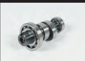
スポーツカムシャフト(N-15カム)