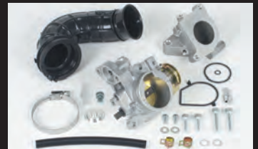
ビッグスロットルボディーキット