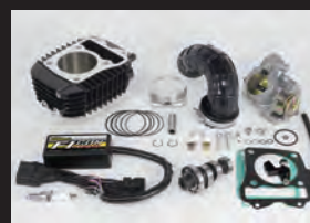
Hyper S-Stageボアアップキット181cc