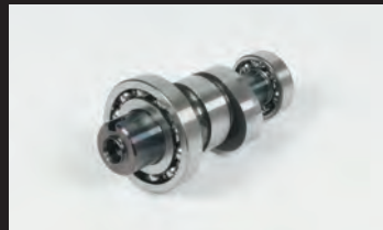
スポーツカムシャフト(N-15)