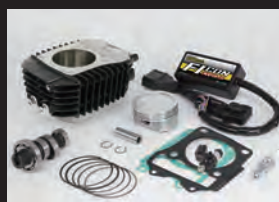
Hyper S-Stageボアアップキット181cc