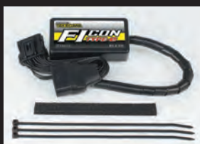
FIコンTYPE-e(インジェクションコントローラー)