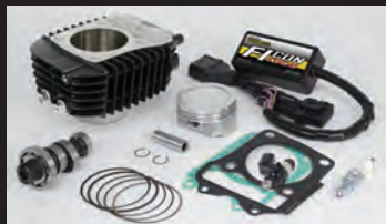
Hyper S-Stageボアアップキット181cc (ノーマルスロットルボディ仕様)