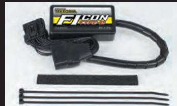
Ficon TYPE-e(インジェクションコントローラー)