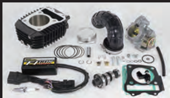
Hyper S-Stageボアアップキット181cc (ビッグスロットルボディ仕様)