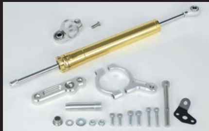
ステアリングダンパーセット