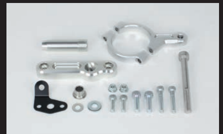
ステアリングダンパーステーキット