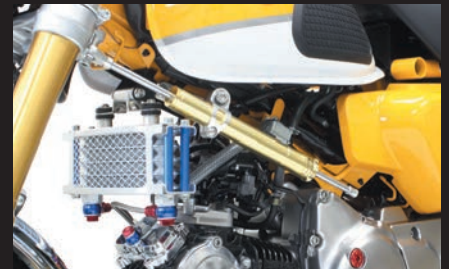
弊社製コンパクトクルキット同時装着可能