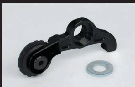
スーパーカムチェーンテンショナー