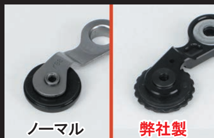
ローラーにスプロケット形状を採用