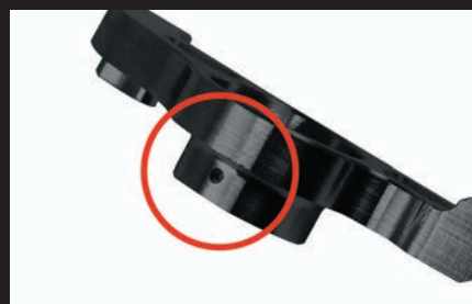
アーム可動部にオイル穴を採用