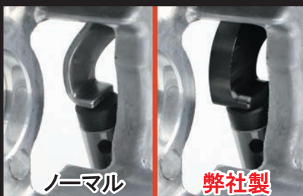
プッシュロッド接地面の比較