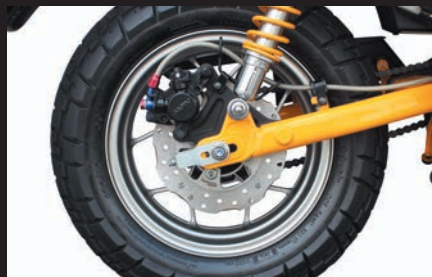
装着写真(モンキー125)