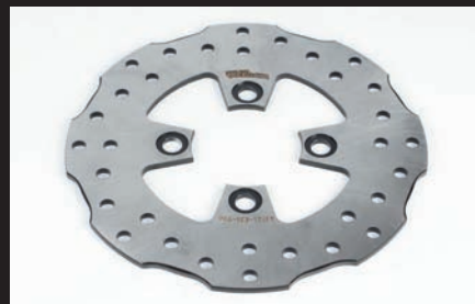
リアディスクローター(ウェーブ形状)