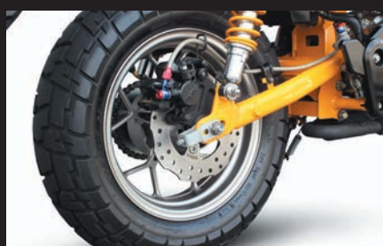
装着写真(モンキー125)