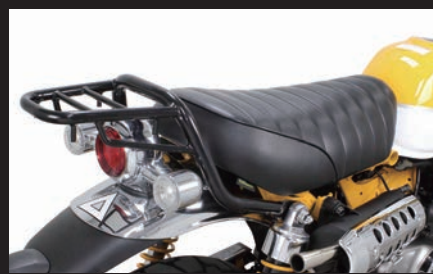
弊社製リアキャリア同時装着