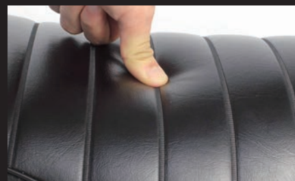
クッション性を損なわないスポンジの厚みを確保