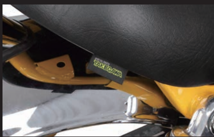
弊社ロゴタグ付き