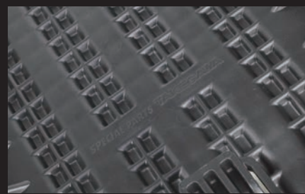
シート裏側(ロゴ入り)