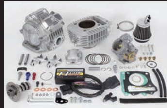
スーパーヘッド4V+R コンボキット181cc (ビッグスロットルボディ付) (01-05-0608)