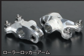
ローラーロッカーアーム

インスペクションブリーザーカバーが付属している為、別途オイルキャッチタンクキットをご購入頂くことで、エンジンの内圧力を逃がすことが出来ます。インスペクションブリーザーカバー、インスペクションカバー、Lシリンダーヘッドサイドカバーはアルミダイカスト製バレル研磨仕上げ