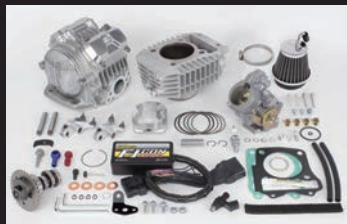
スーパーヘッド4V+R コンボキット181cc (ビッグスロットルボディー付属) (01-05-0608)