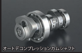
オートデコンプレッションカムシャフト

※排気量が125cc以上になる為、原付二種登録では一般公道を走行することは出来ません。競技専用になります。 ※ポアアップキットを装着する際、クラッチの滑りを防止する弊社製スペシャルクラッチキット、各種マフラーの同時装着をお薦めします。 ※FIコン TYPE-Xの装着に関しては、お客様のPC、又はスマートフォンの使用環境、インターネットの接続、注意事項があります。別紙をご覧ください。