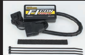
FIコン TYPE-X(インジェクションコントローラー) (05-04-0118)