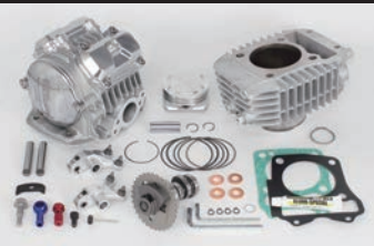
スーパーヘッド4V+R ポアアップキット181cc (シルバー仕様) (01-05-0173)