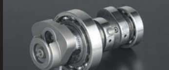
オートデコンプレッションカムシャフト