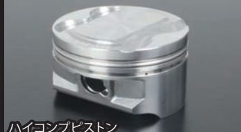
ハイコンピピストン