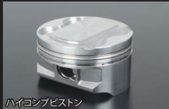
ハイコンピストン