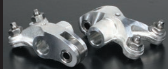
ローラーロッカーアーム