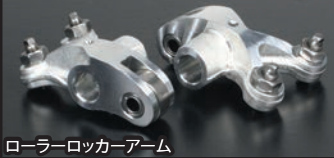
ローラーロッカーアーム

■マグネット付きドレンボルト(シルバー) ドレンボルト本体はアルミ材を精巧に削り出し、表面にカラーアルマイトを施しています。エンジンオイルに混ざった鉄粉をドレンボルトに設けたマグネットが強力な磁力で吸着します。これにより、オイル内にある鉄粉が減少し、エンジンオイル本来の安定した潤滑性能を発揮することが出来ます。更に弊社製アルミドレンボルトには、脱落防止としてワイヤーロックが行えるワイヤーロック穴と弊社製スティック温度センサー差込穴を備えています。スティック温度センサーの取付けが可能で、弊社製コンパクトLEDサーモメーター(スティック温度センサー付き)又はサーモメーター付き各種メーターを別途ご購入頂くことでドレンボルト部の温度を計測することが出来ます。