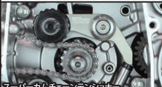
スーパーカムチェーンテンショナー