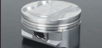
ハイコンピピストン