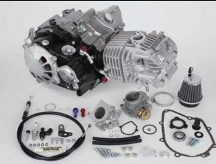
スーパーヘッド4V+Rコンプリートエンジン181cc スペシャルクラッチ TYPE-R WET(湿式)/ワイヤー式 GROM(JC61-1300001~)/JC75-1000001~)用