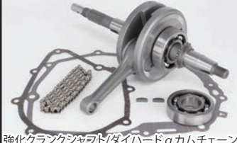
強化クランクシャフト/ダイハードαカムチェーン