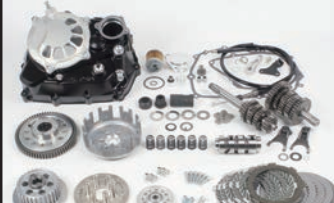
スペシャルクラッチ TYPE-R (DRY/ワイヤー式)