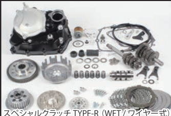
スペシャルクラッチ TYPE-R (WET/ワイヤー式)