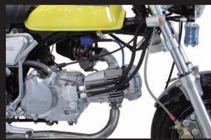
装着写真(3フィン4オイルライン)