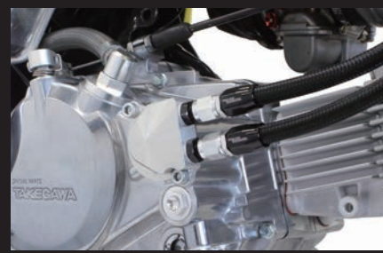
装着写真(オイル取り出し口)