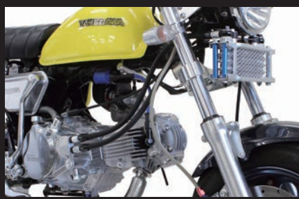
装着写真(4フィン5オイルライン)