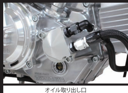
オイル取り出し口