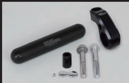
マルチステーブラケットキット(ブラック)