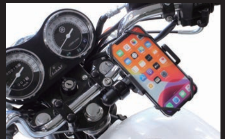
装着写真:YB125SP(ブラック/モバイルホルダー装着)