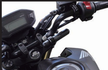
装着写真:GROM(ブラック)