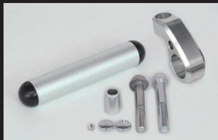
マルチステーブラケットキット(シルバー)