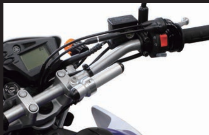
装着写真:SEROW250(シルバー)