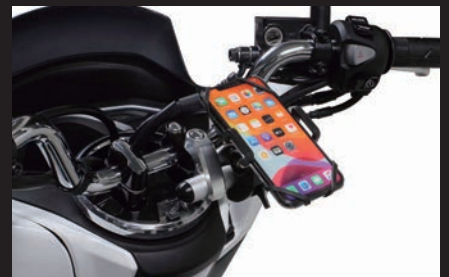
装着写真:PCX(シルバー/モバイルホルダー装着)