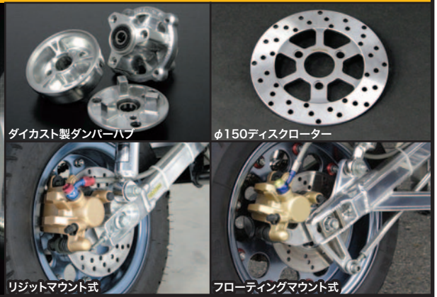
ダイカスト製ダンパーハブ