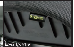
弊社ロゴ/タグ付き