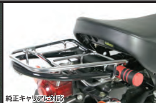
純正キャリアに対応