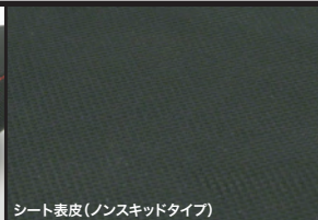
シート表皮(ノンスキッドタイプ)