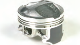
鍛造ピストン(モリブデンコート)