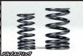
バルブスプリング