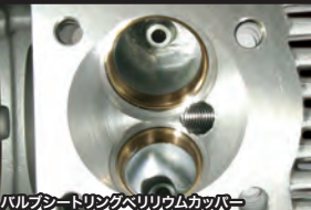
バルブシートリングベリリウム銅カバー

対象車両/フレームNO. モンキー・ゴリラ(Z50J-2000001 ~ / AB27-1000001~1899999) モンキー-BAJA(Z50J-1700001~) モンキー-R(AB22-1000017~) モンキー-RT(AB22-1007601~) XR50R(AE03-1000001~) CRF50F(AE03-1400001~)