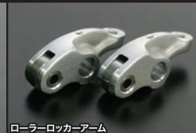
ローラーロッカーアーム