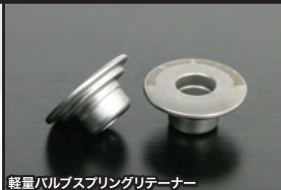
軽量バルブスプリングリテーナー