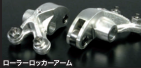
ローラーロッカーアーム