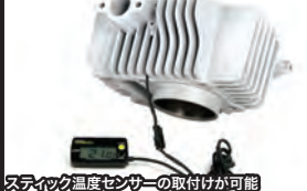
スティック温度センサーの取付けが可能