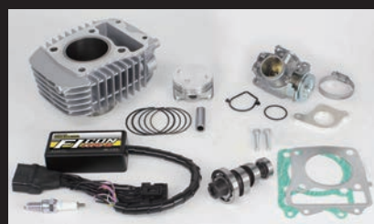
ハイパーeステージボアアップキット143cc