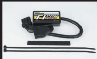
FIコンTYPE-e(インジェクションコントローラー)