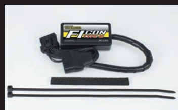
FIコンTYPE-e(インジェクションコントローラー)