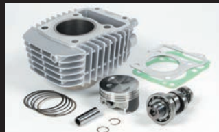
eステージボアアップキット143cc