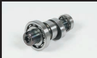
スポーツカムシャフト(N-15カム)