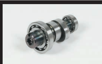
スポーツカムシャフト(N-15)