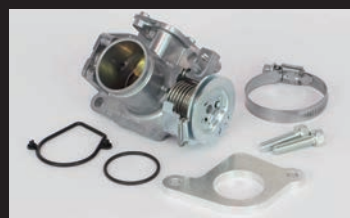
ビッグスロットルボディークット