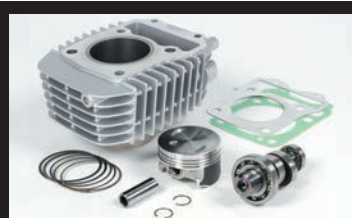
eステージボアアップキット143cc