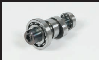
スポーツカムシャフト(N-20)