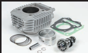
Sステージボアアップキット181cc