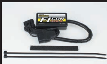
FIコンTYPE-e(インジェクションコントローラー)