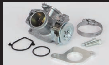
ビッグスロットルボディークット