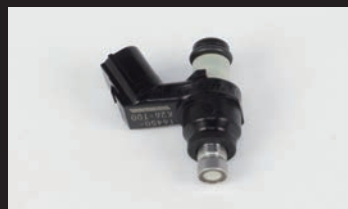
フューエルインジェクターASSY.(G-1)