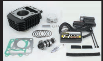
ハイパーeステージボアアップキット143cc