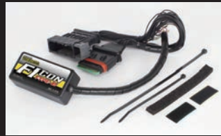
FIコン TYPE-e(インジェクションコントローラー)