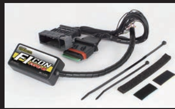
FIコンTYPE-e(インジェクションコントローラー)