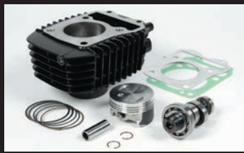
eステージボアアップキット143cc